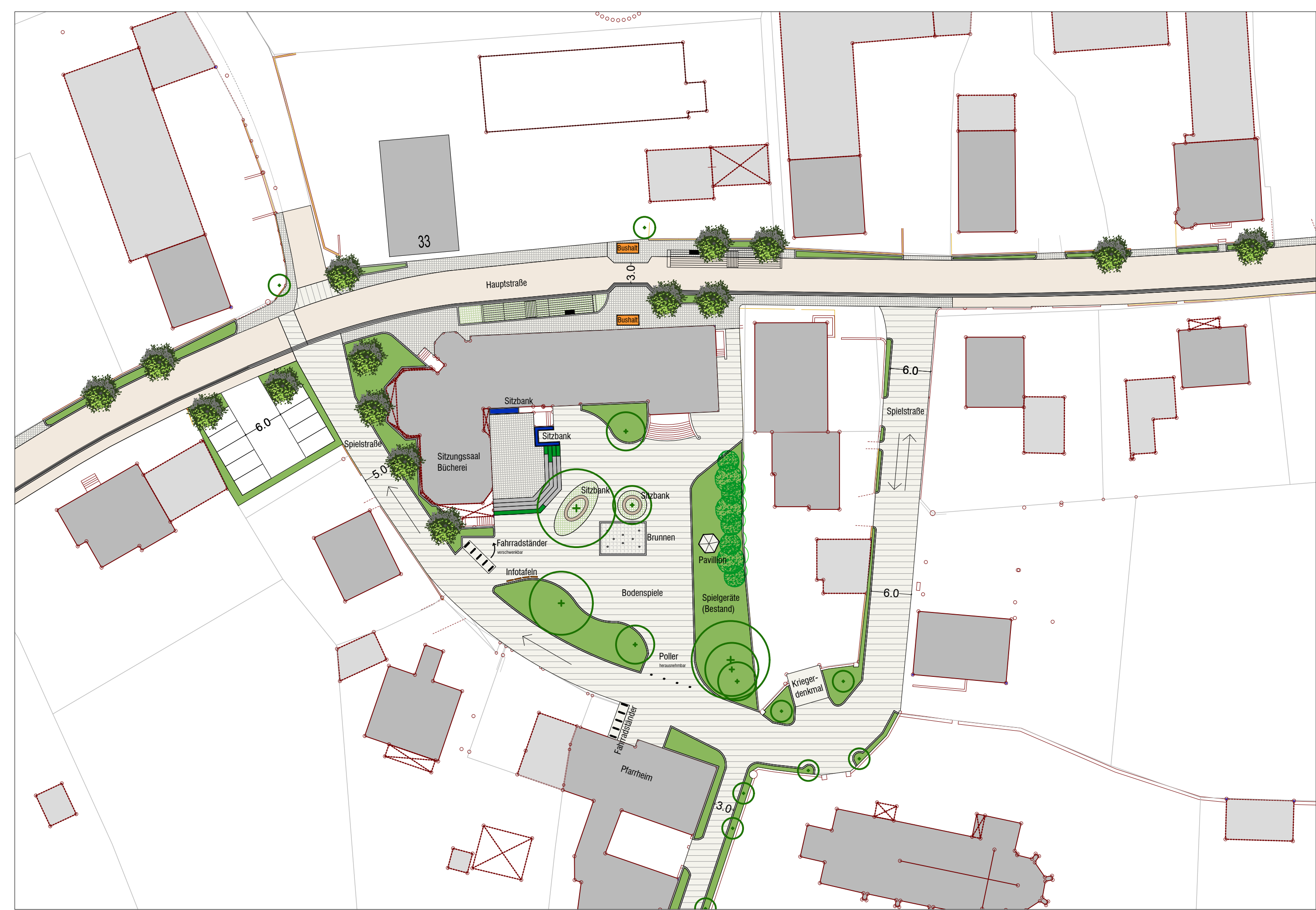
Martinsplatz, M 1: 500