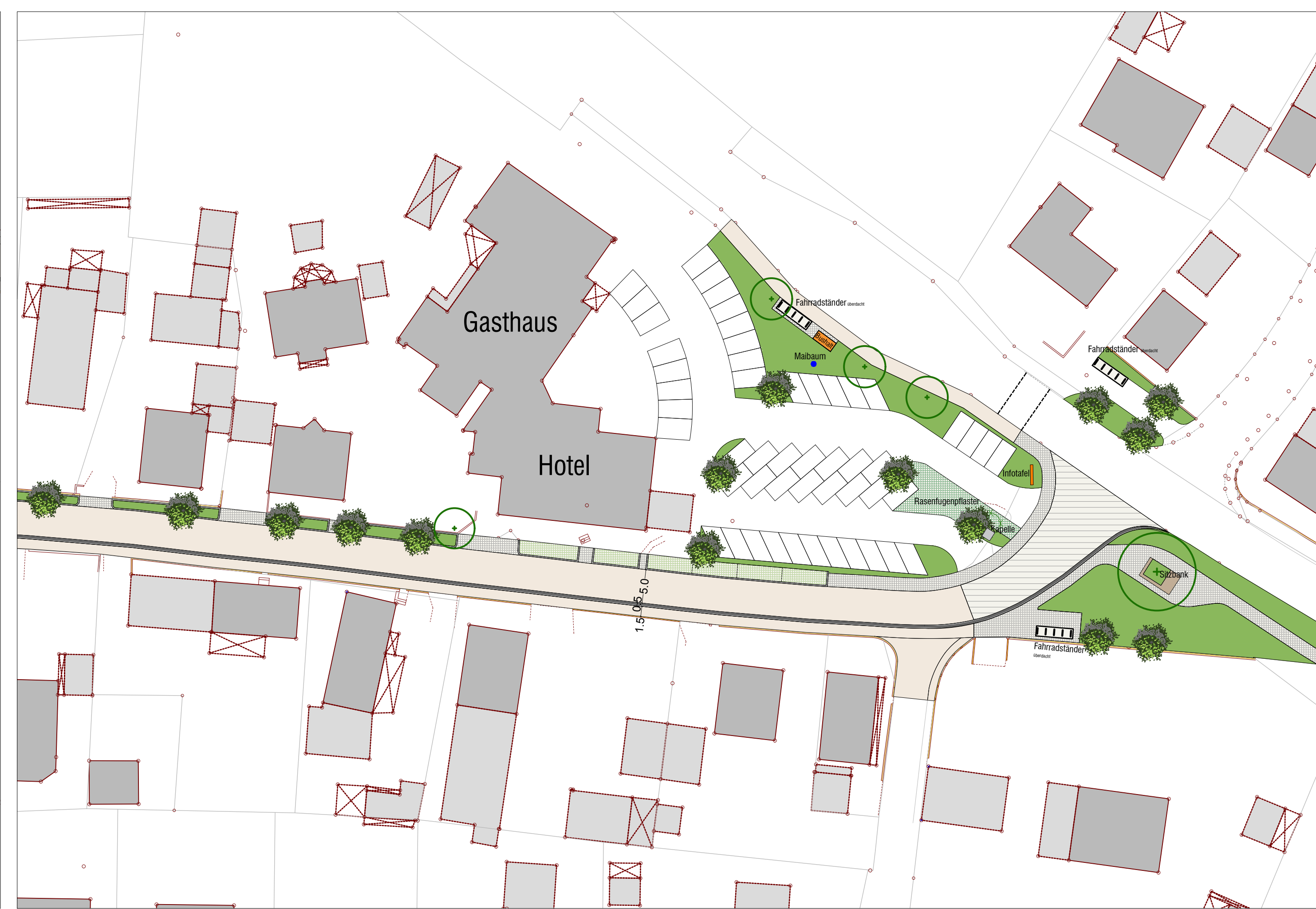
Vorplatz Platzler, M 1: 500