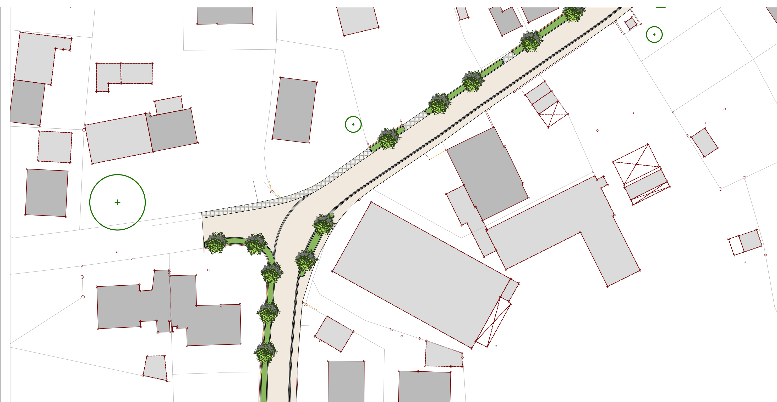
Straßenknotenpunkt, M 1: 500