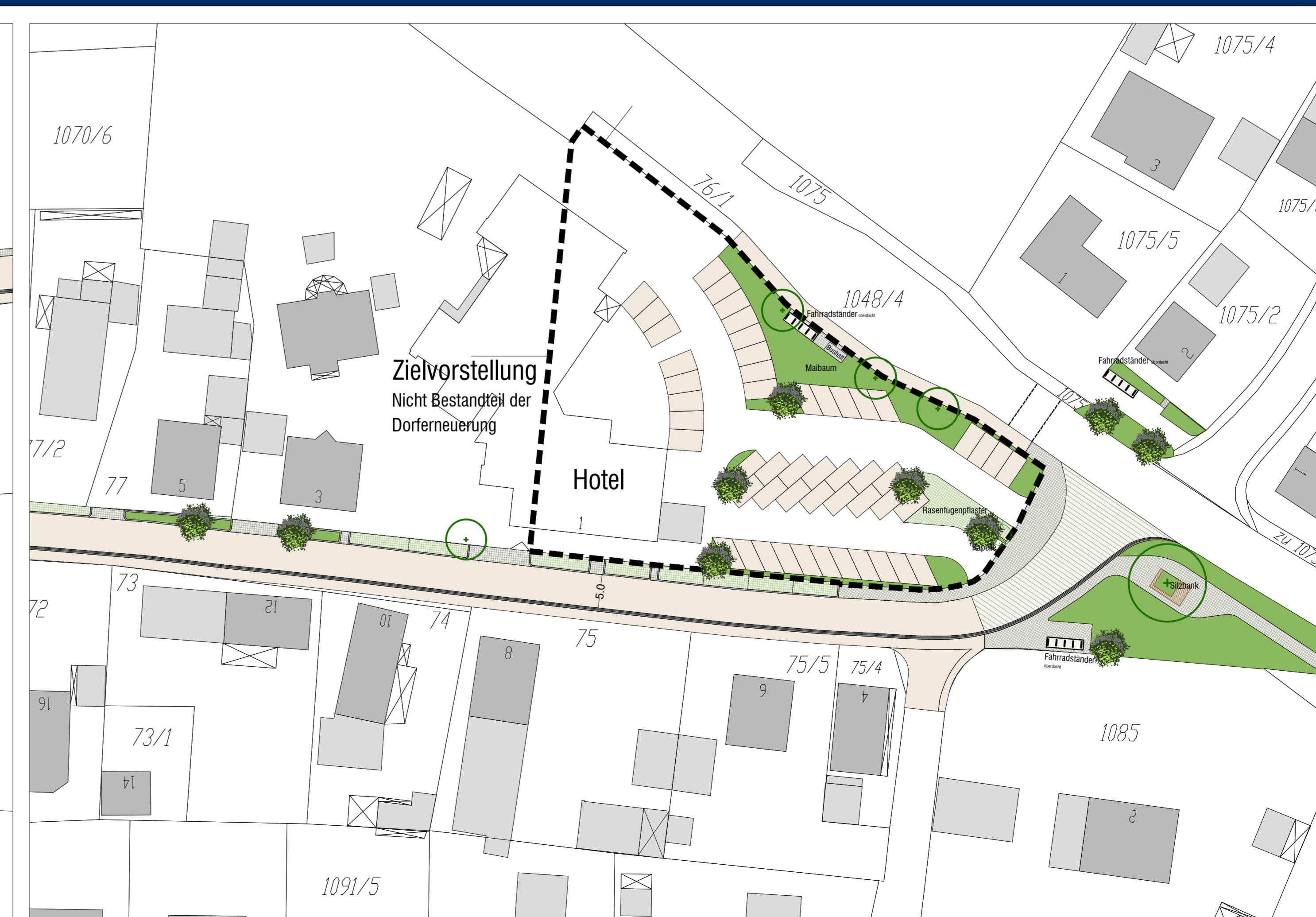
Vorplatz Platzer, M 1: 500