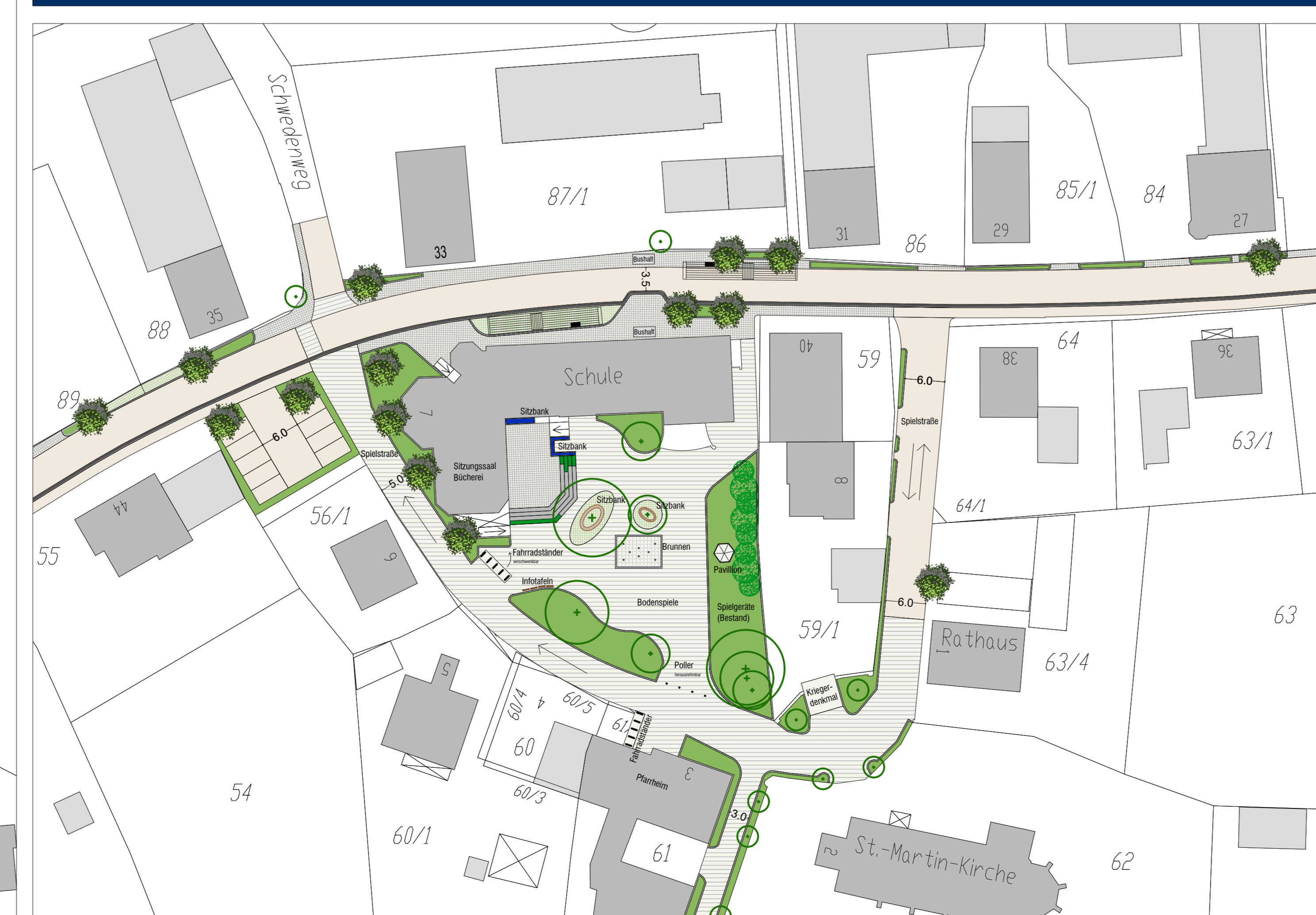
Martinsplatz, M 1: 500