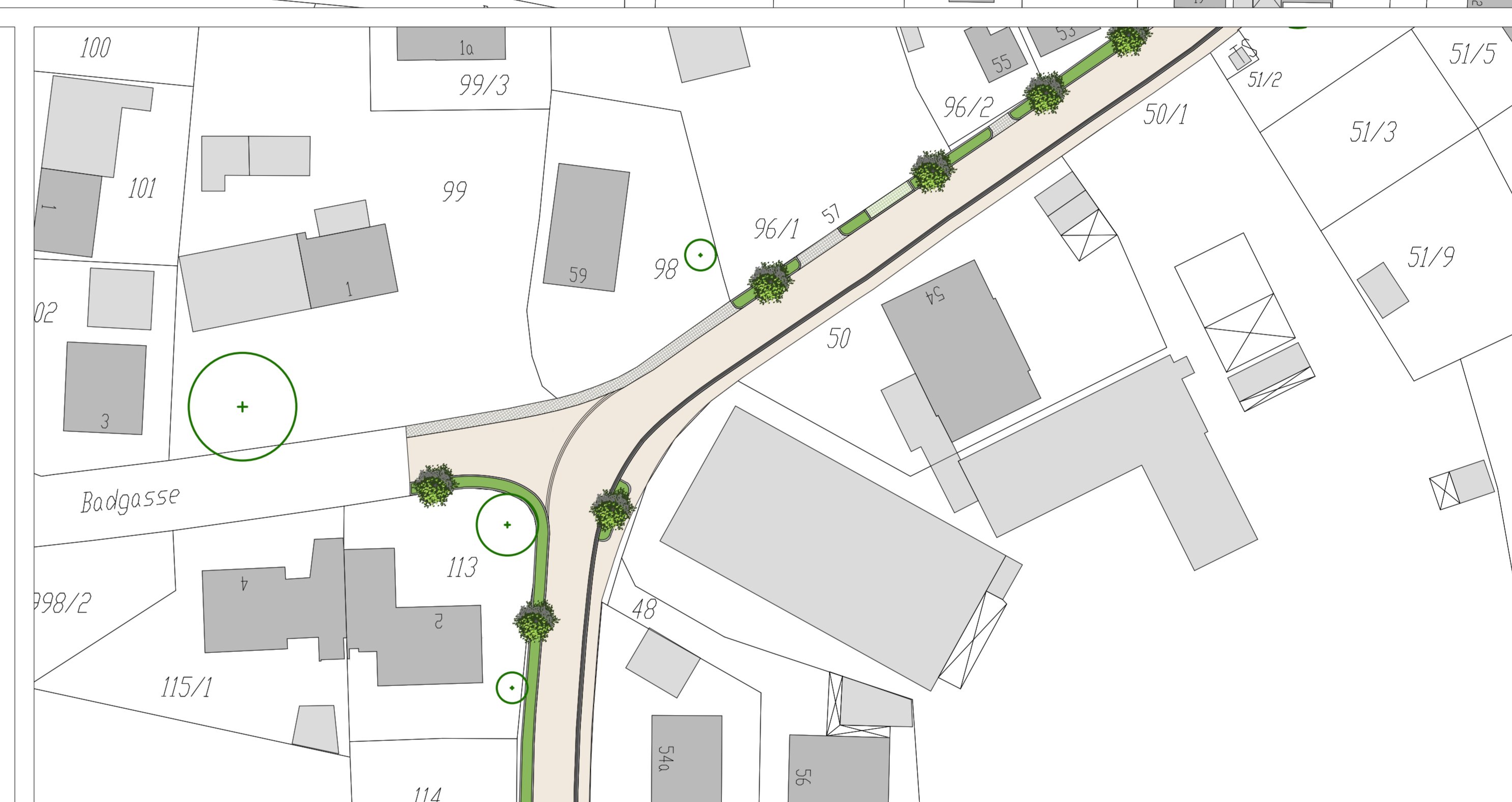
Straßenknotenpunkt, M 1: 500